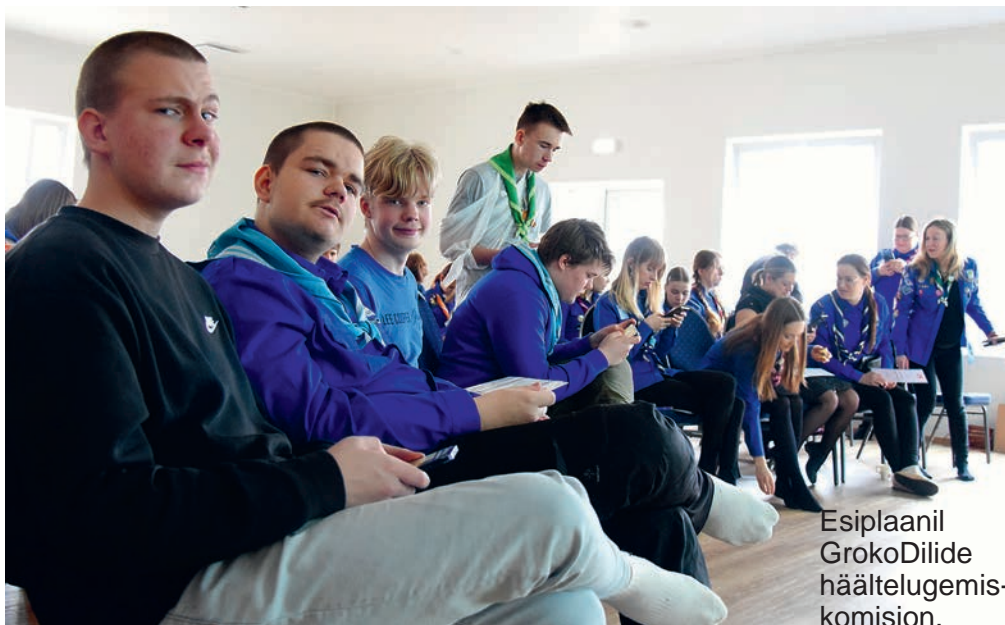
Esiplaanil GrokoDilide häältelugemiskomisjon.