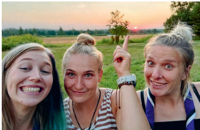
Laosel paistab alati päike, eriti sõpradega.

Koostöö, koostöö, koostöö! Nipp 1: ära küsi „kas keegi võiks teha“, sest „kedagi“ ei ole olemas. Sa lähed küsid