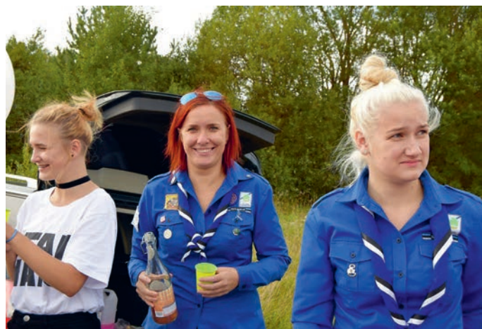
Südamematka finišis lõpetajaid õnnitlemas.

eraldi ja otse, mitte juhatuse vestluses. Sa mõtle läbi, kes oleks ideaalne, kes saaks teha ja küsi otse. „Kas keegi saaks laagri vetsus paberi ära vahetada“ – mitte keegi ei tee seda. Lähed teed ise lõpuks.