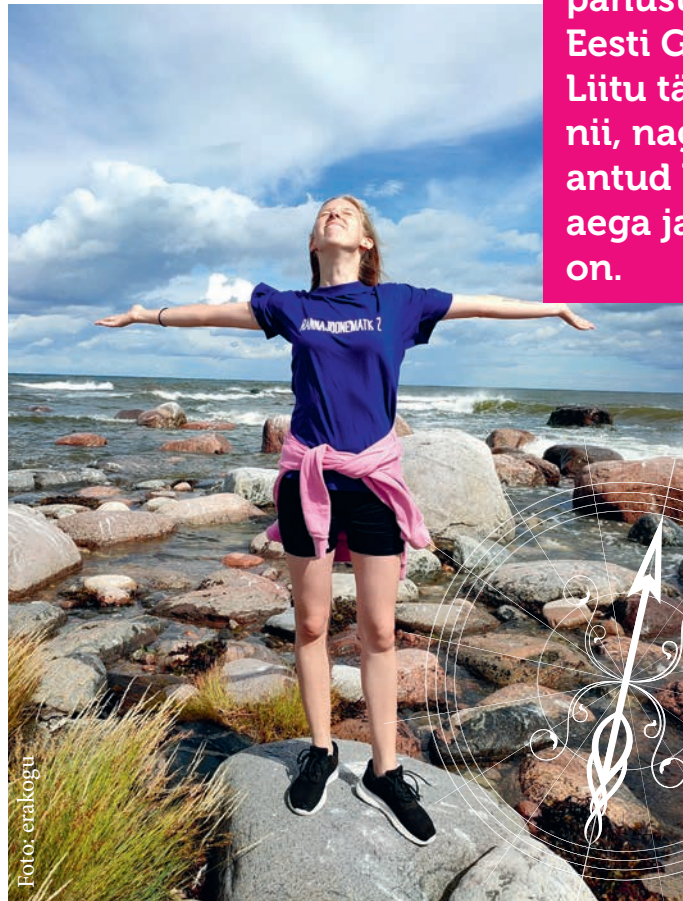
Sirli on käinud läbi terve Eesti rannajoone.

Ja siis on meil see teine pool: „tahtlikkus”. Eks meil kõigil on omad põhjused, miks me gaidlusesse tulime ja miks me siia püsima jääme. Ma ei usu saatusesse, aga kui oleks midagi, mis suudaks mind veenda selle võimalikkuses, oleks selleks ilmselt minu s a t t u m i n e