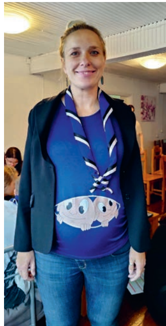
Selles kohus olid kõige pisemad gaidikesed.

pooli alati kaitsta konfliktides. Mitte keegi ei tea, kui palju ma olen pidanud teid kõiki kellegi teise eest kaitsma. Mingid asjad ma olen jätnud tagatubadesse. Mulle meeldib omavahel rääkida, tihtipeale on emotsioone palju ja asja tuum on tegelikult kuskil mujal, mis jääb märkamata suurte tunnete tõttu. Kui sa inimestega otse räägid, siis on probleeme lihtsam lahendada. Keegi minuga otse konflikti pole astunud, mis pole eestlaste ega naiste seas reaalne. Ma väga tänan neid, kes mind on kuskil kaitsnud. See on