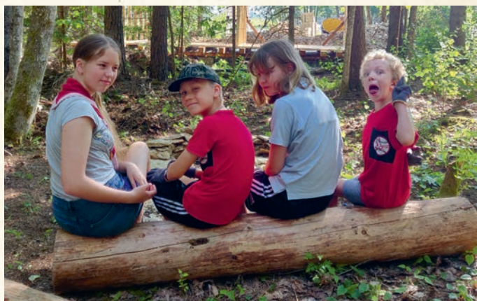
Häid kirsikarusid mahub ühele pingile ikka palju.