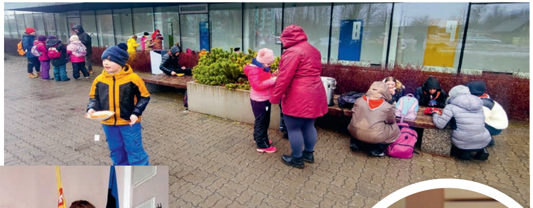
Toidupunkti jõudsid matkalised vettinutena.