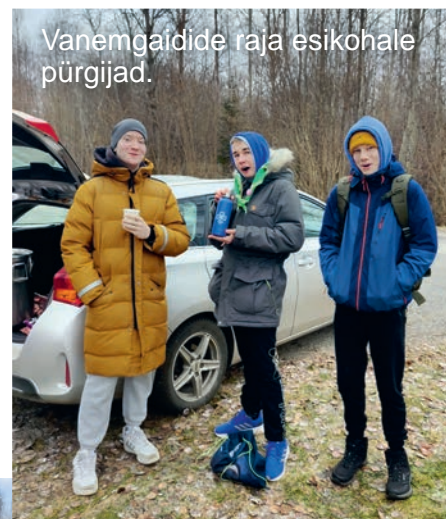
Vanemgaidide raja esikohale pürgijad.