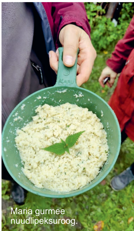
Maria gurmee nuudlipeksuroog.