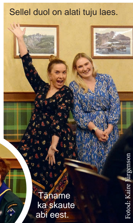
Sellel duol on alati tuju laes.