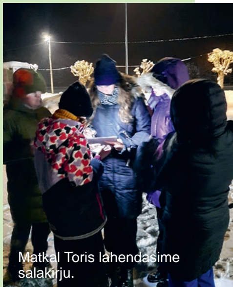
Matkal Toris lahendasime salakirju.