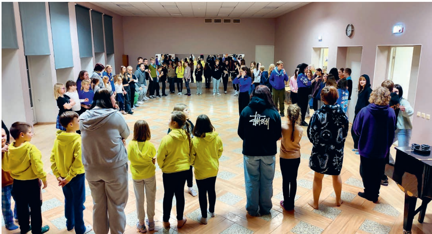
Mänguks kõik ringi!