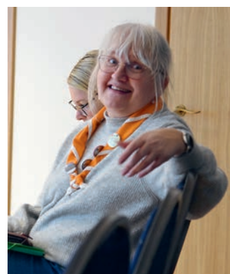
Tiina kuulis vist midagi eriti head!