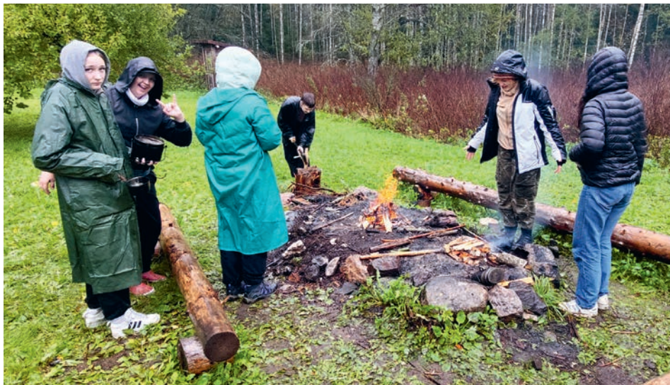
Lõkkelõhnad on üleval ja katelokid pihus.