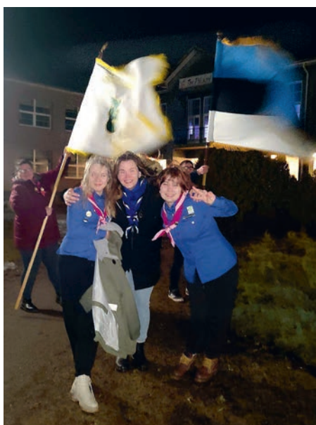
Igati tormine Päikesekarude töötuse andmine.