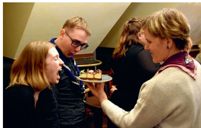
Koogitüki pärast läheb veel võitluseks.