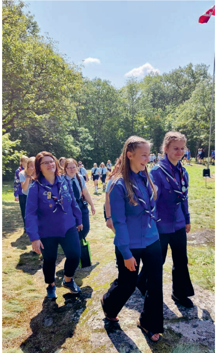
Kanada laagri lõpetamisel.