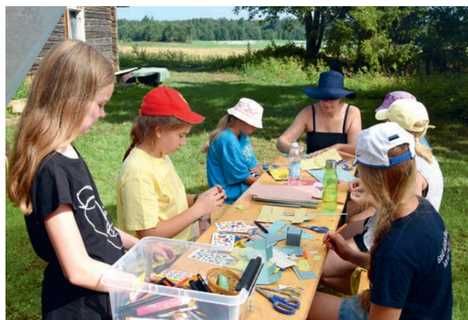
Mailiisi käe all vihmase ilma tegevuste nuputamine.