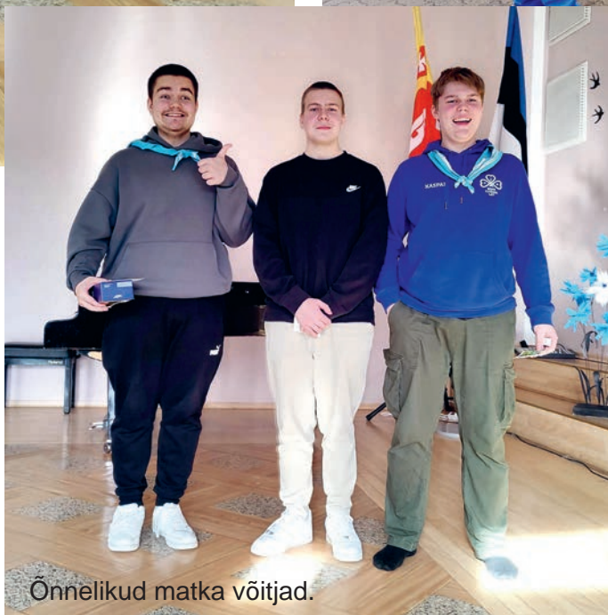
Õnnelikud matka võitjad.

kujutada parimaid mälestusi gaidlusest. Nende ülesandeks oli piltidele püüda mälestusi laagritest ja sündmustest, kus sai sõpradega koos olla ning uusi ja vajalikke oskusi koguda.