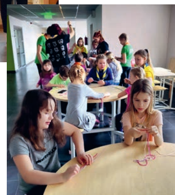
Tõsine nokitsemine peale matka.