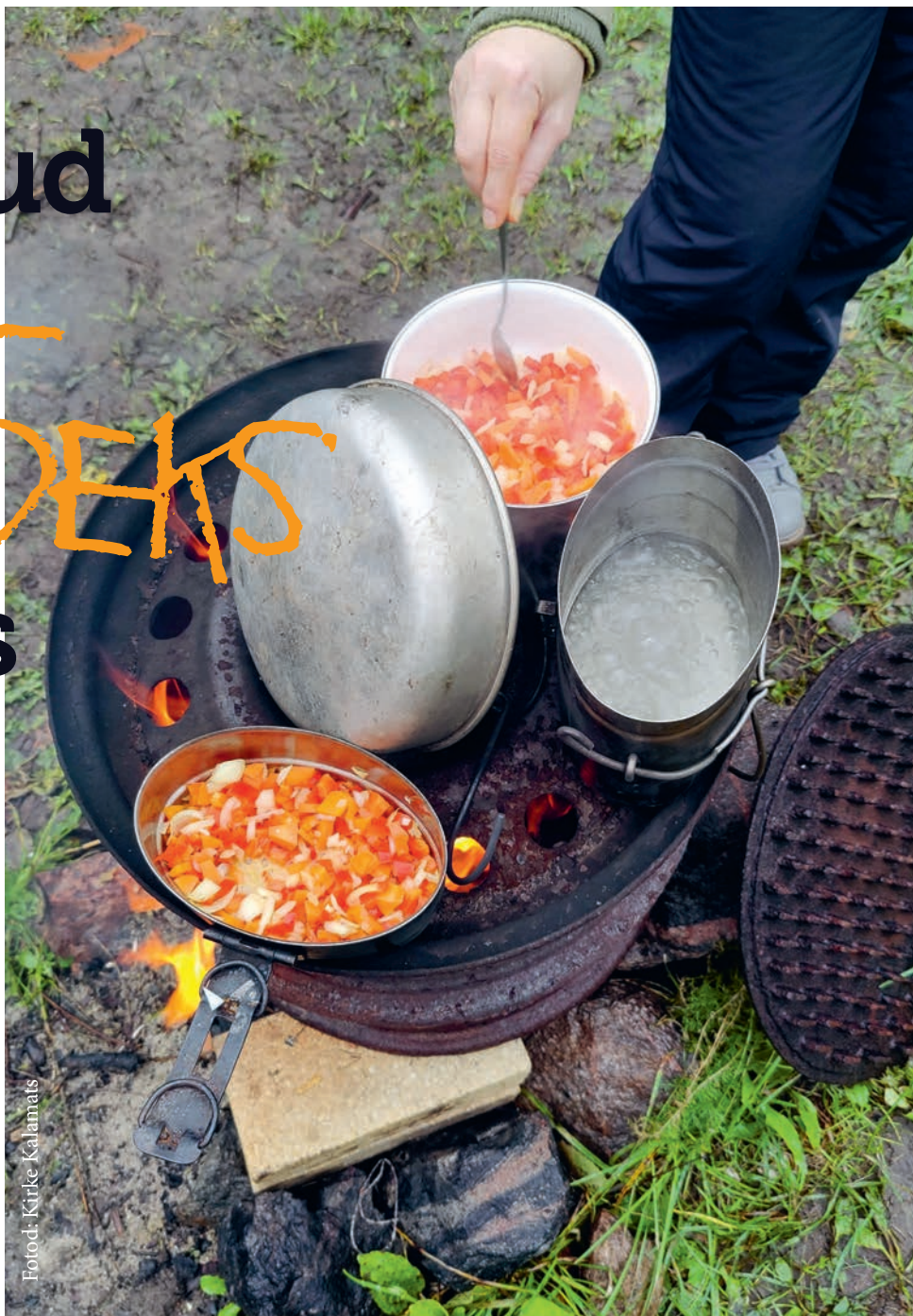
Veljelõke töötas imeliselt.

Järgmiseks osaks pidi olema praktiline osa õues, mille esimeseks väljakutseks osutus ilmastikule sobilik riietus. Aknast piiludes töötas tulla poolvihmane, mõnusaalt porine ja tuuline sügispäev. Alustasin oma sonetti noorte suunas, mis kandis pealkirja “Müts, sall, kindad”. Selle ilusa