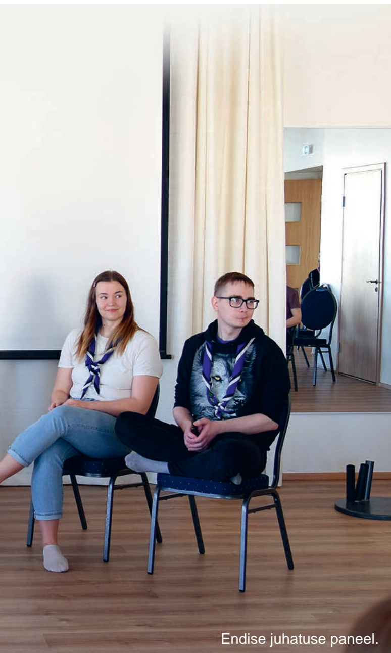
Endise juhatuse paneel.