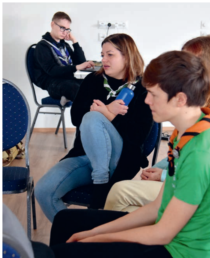
Igaüks oma nõupidamisel.