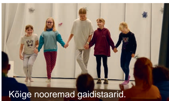
Kõige nooremad gaidistaarid.