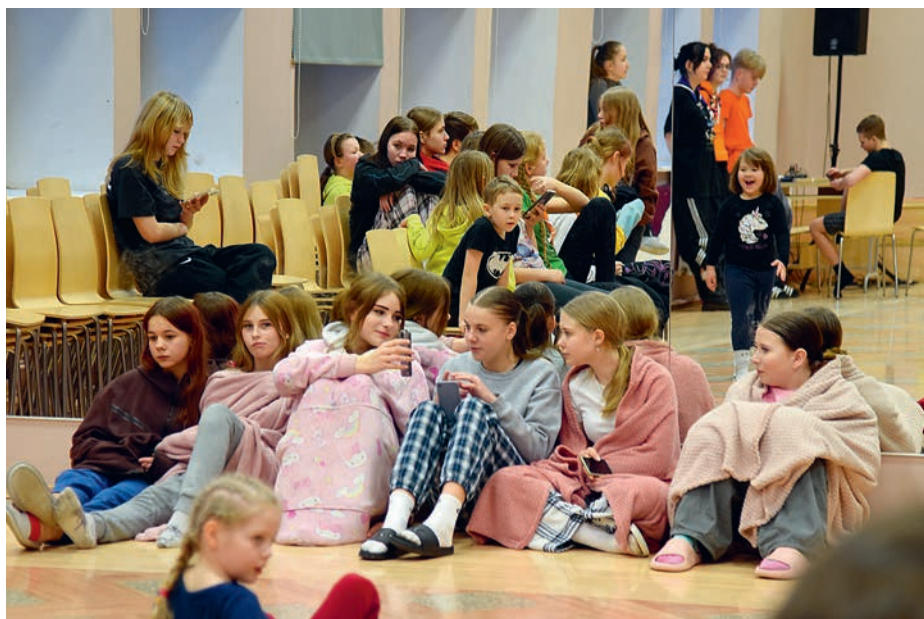
Pidžaamapidu enne õhtust programmi.