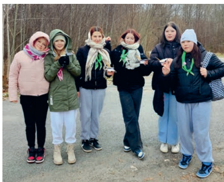
Nõo Langevad Tähed ja Päikese- karud.