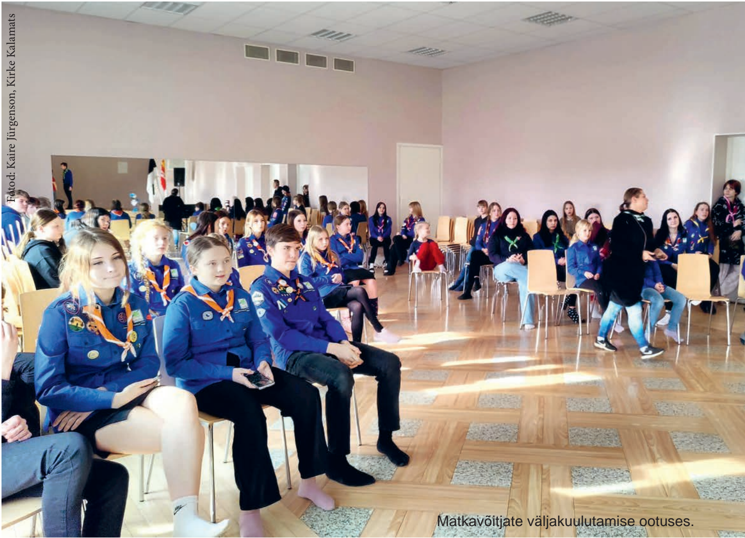
Matkavõitjate väljakuulutamise ootuses.