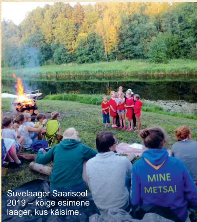
Suvelaager Saarisool 2019 – kõige esimene laager, kus käisime.