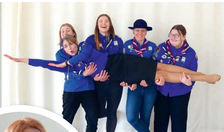
Grislid lausa hõljuvad peale koosolekut.