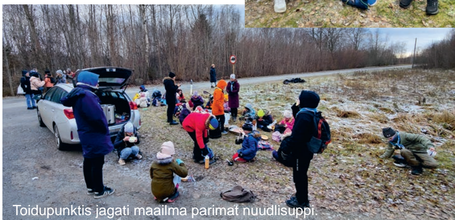
Toidupunktis jagati maailma parimat nuudlisuppi.