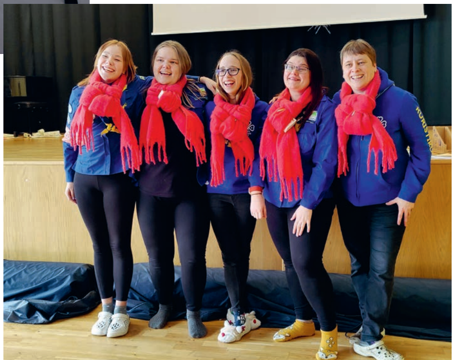
Heade Mõtete Päeva korraldusmeeskonnas.