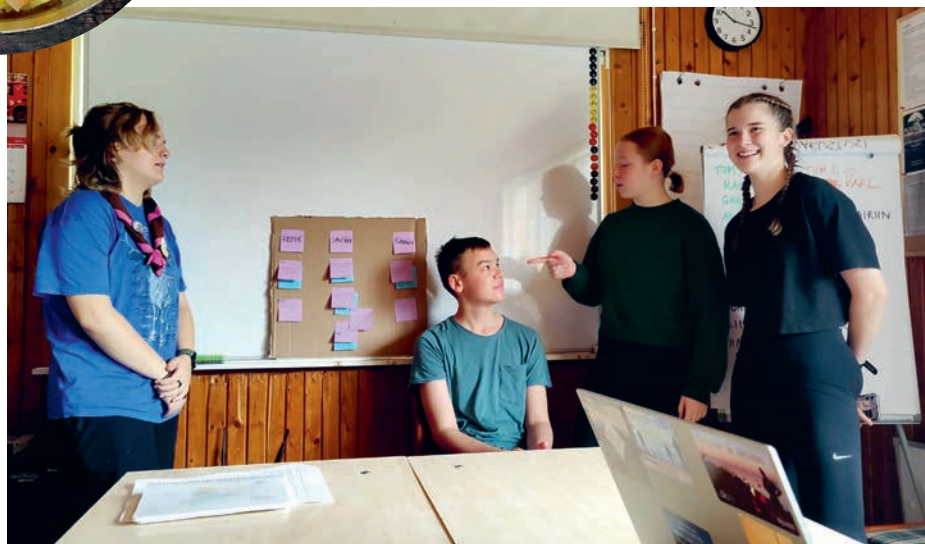
Laagrimenüü karm kaitsmine.