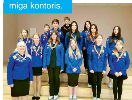
Vormipäev 2024 Tori Põhikoolis.