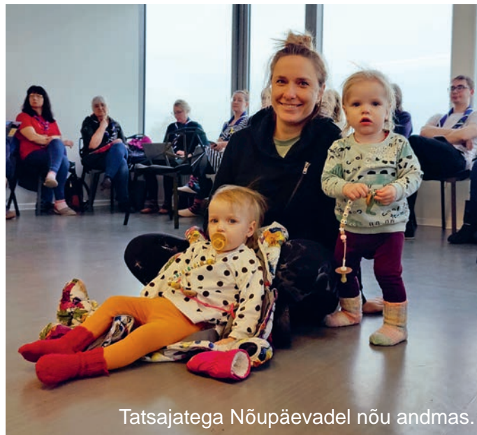
Tatsajatega Nõupäevadel nõu andmas.

okei, et see pole jõudnud ka kuskil minuni ja ma pole ise pidanud oma maine eest võitlema või selgitama.