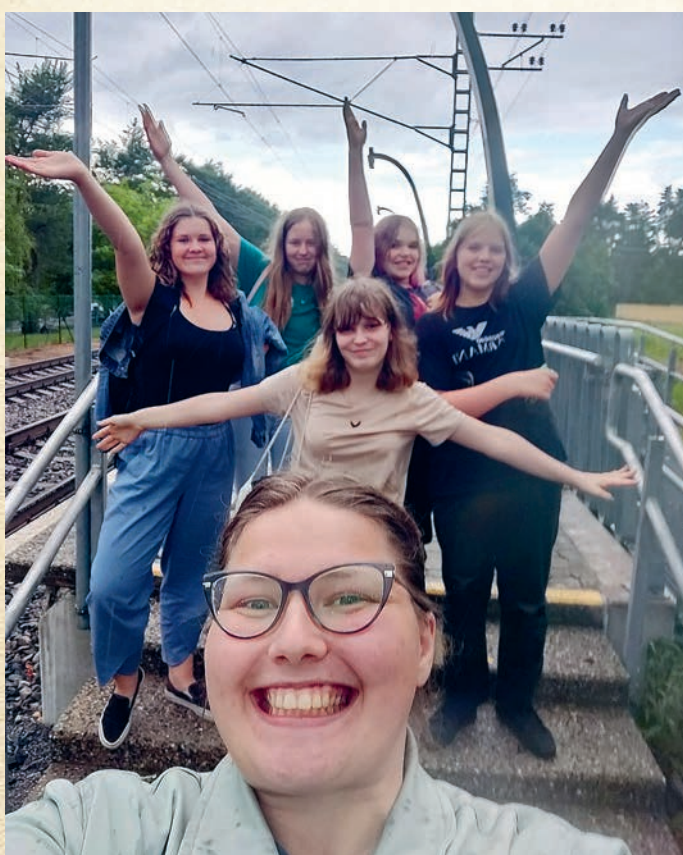
Teel Haapsalusse nädalavahetuse koondusele.