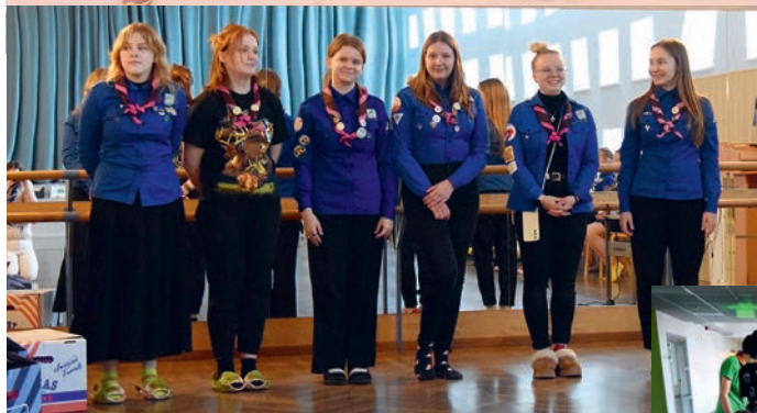
Aitäh, tublid korraldajad!