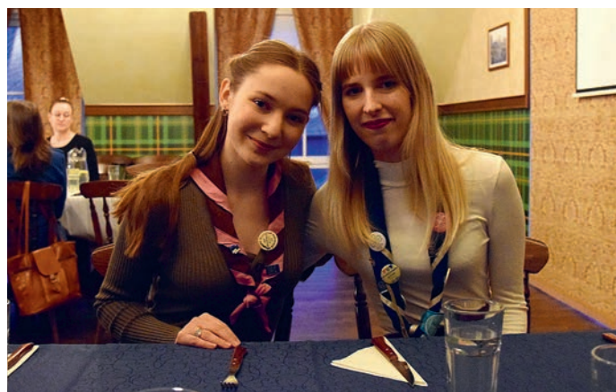
Endine ja praegune noortekogu juht.