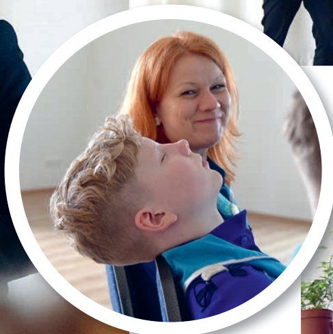
No mõned teemad võiks küll vahele jätta.