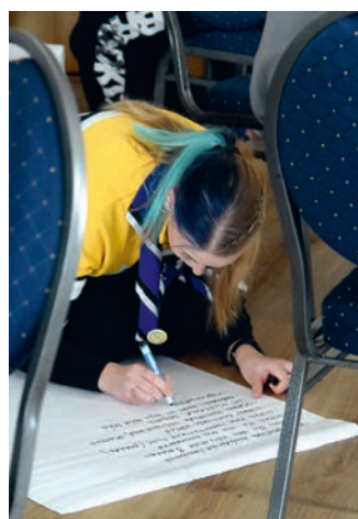
Kirke kannab kõik hea paberile.