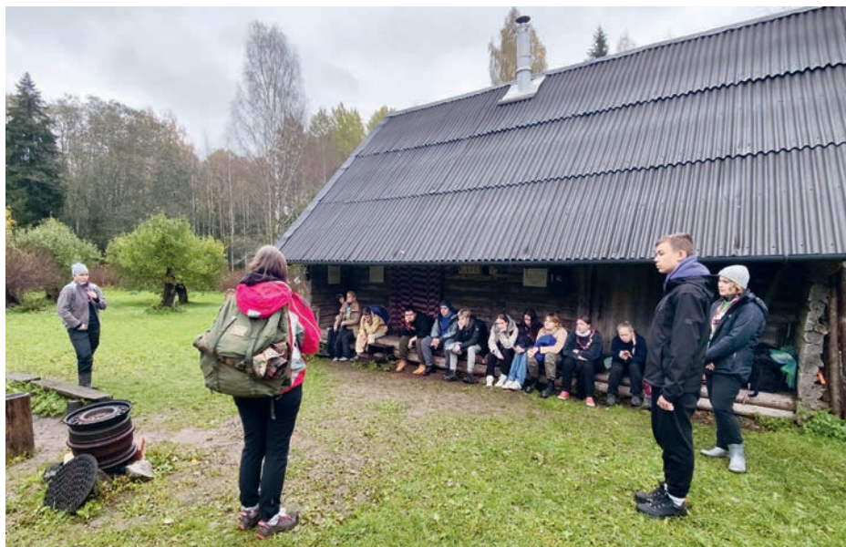
Tiia jagab õpetussõnu eelseisva kohta.