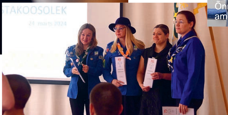
Pärnu gaididel mandaadid käes.