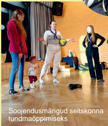
Soojendusmängud seltskonna tundmaõppimiseks

üksuste koonduse alustamise traditsioonid. Tegelesime ka sügavamate teemadega ja täitsime igaüks Vaimse Tervise Esmaabi töövihikut, milles andsime erinevates valdkondades hinnanguid oma vaimsele tervisele (kellel huvi – https://esmaabi.peaasi.ee/toovihik/ ). Vahepeale mängisime veel aktiivsemaid mängu, näiteks meeskonna usalduse ja tunnetuslikkuse proovile panekuks tuli võtta rivvi, seejärel üksteise õlgadest kinni, silmad sulgeda ja ainult kõige tagumine sai silmad lahti hoida ja pidi õlapatsutustega rääkimata tervet meeskonda punktist A punkti B juhendama. Lõpupoole toimus suur meisterdamising, saime ise teha igasugusest materjalist jõuluehteid ja kaunistasime piparkooke. See oli üks südantsoojendav kokkusaamine. gdj Annabel Klein