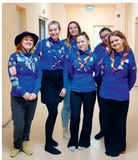
Nauding vormis olemisest.