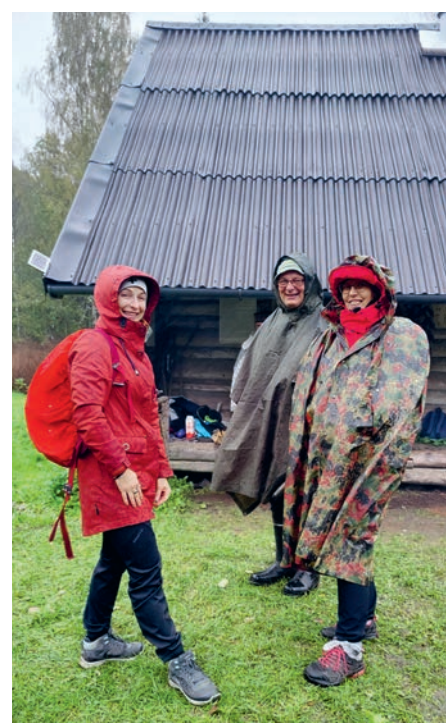
Juhendajad keset kaost.