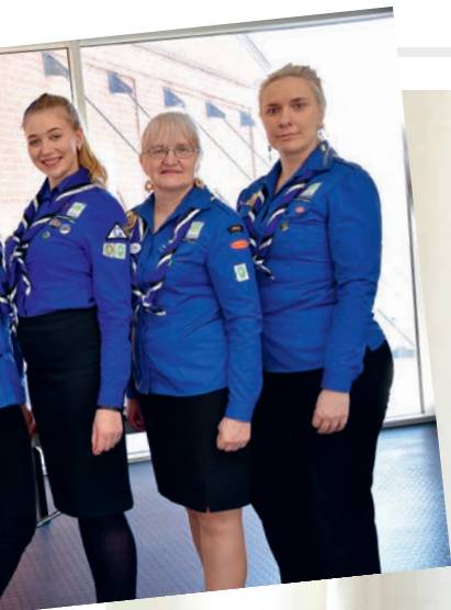
2020. aasta juhatuse koosseis.