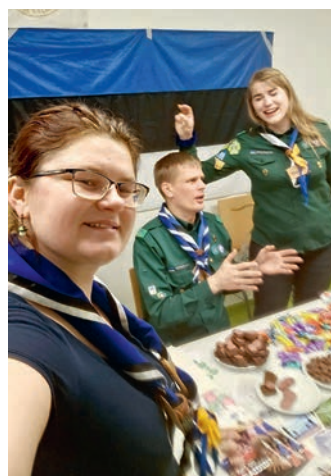
Rahvusvaheline õhtu koos skaudiesindusega.

Eelkõige on selliste ürituste juures oluline kontaktide loomine ja suhtlus teiste gaidide ja skautidega. Selleks saime võimaluse mõnel õhtul koos linna peal käies, näiteks ei unune karaokebaari kogemus, kus juhuslikult suur osa üri-