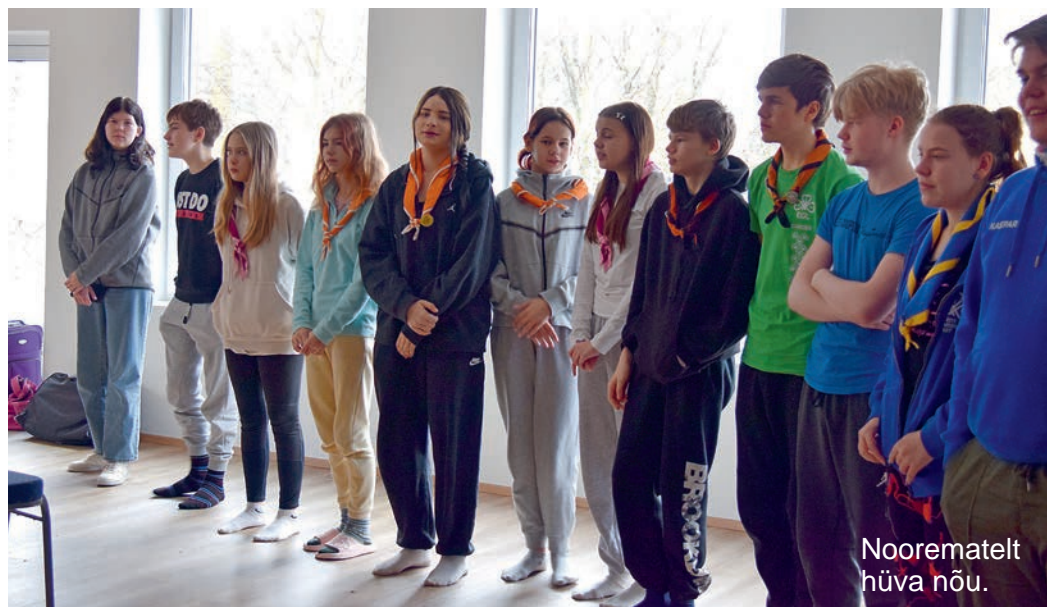
Nooremalt hea nõu.