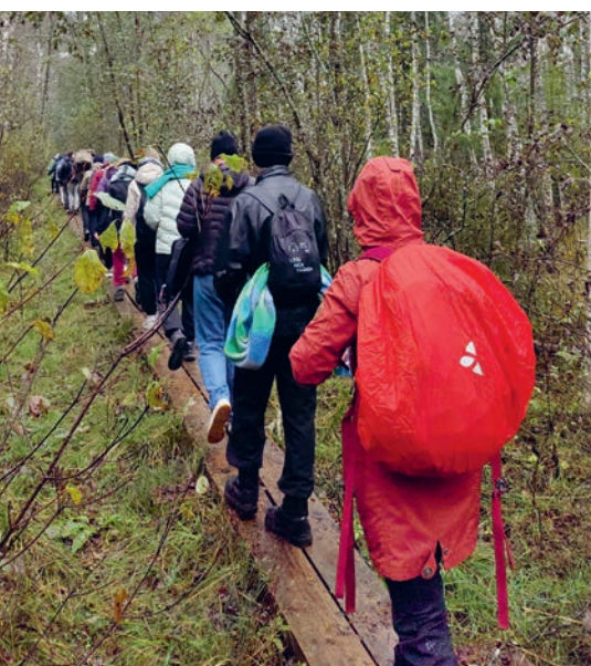
Kõik süüa tegema!