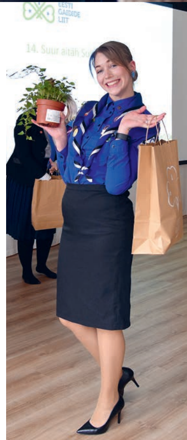
Aitäh liikmeskonna koordinaatorile.