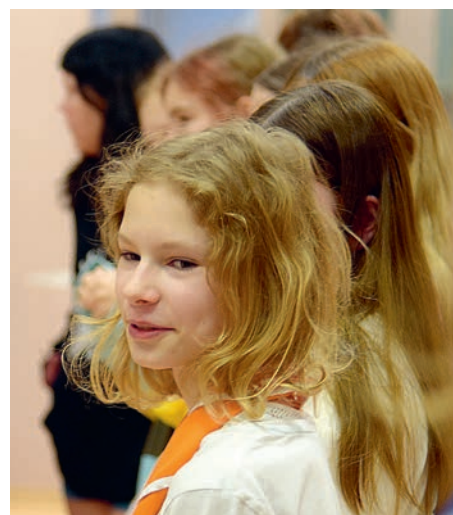
Kavala ilmega programmile vastu.