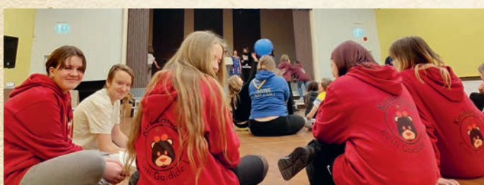
Nõo HMP laager 2022 – Kirsikarud oma pusadega.