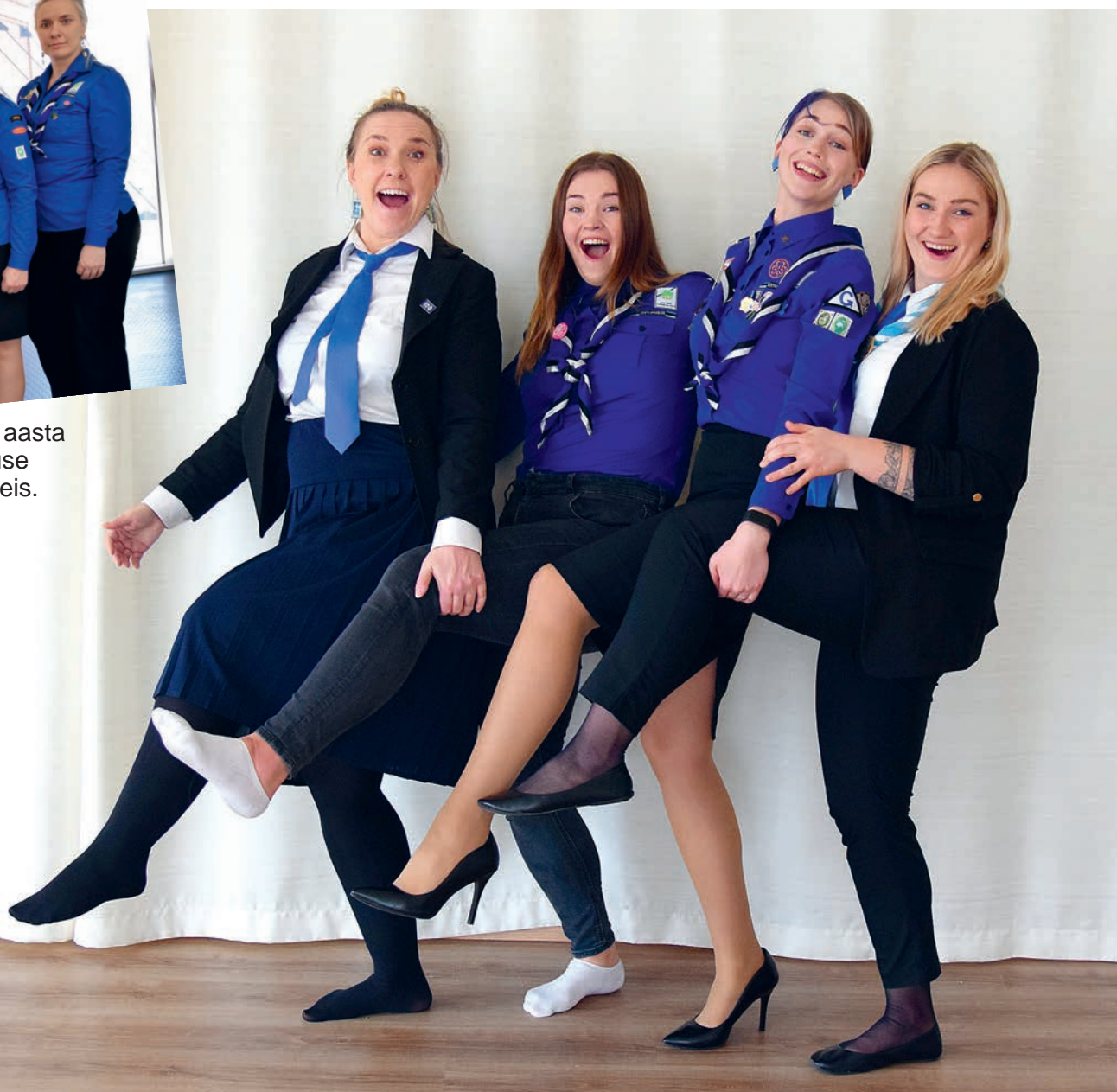
Juhatuses välja astumas kevadel 2004.