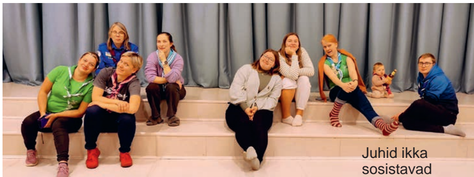
Juhid ikka sositavad omavahel.